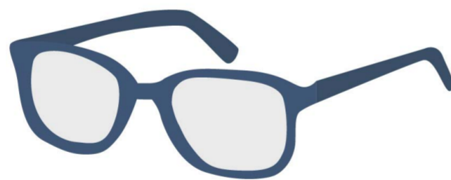
LUNETTES (DE VUE) glasses