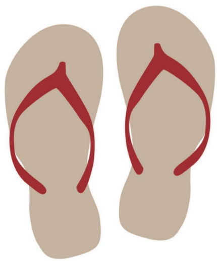
SANDALES sandals / slippers