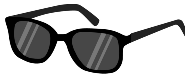
LUNETTES DE SOLEIL sunglasses